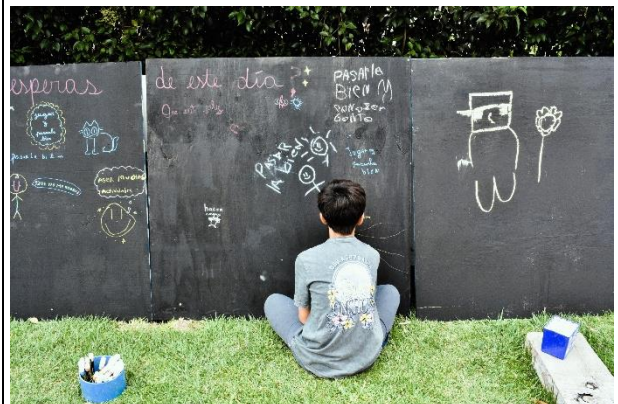
Fotografía 4: Dazibao.