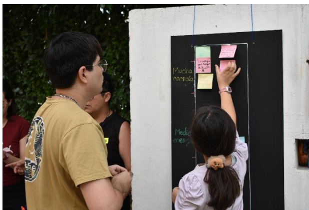
Fotografía 7: Animómetro