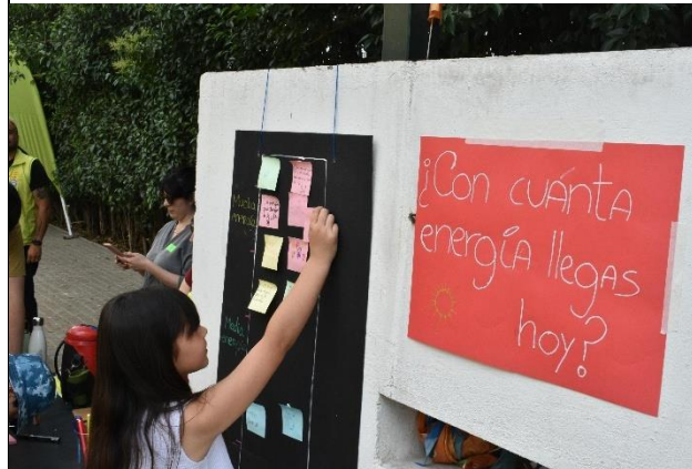
Fotografía 6: Animómetro