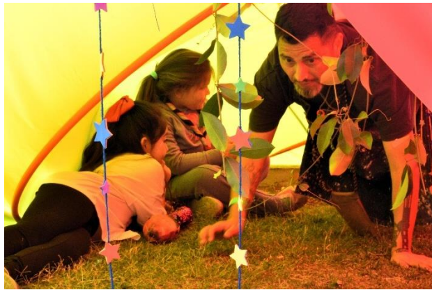
Fotografía 1: Umbral elaborado para la jornada