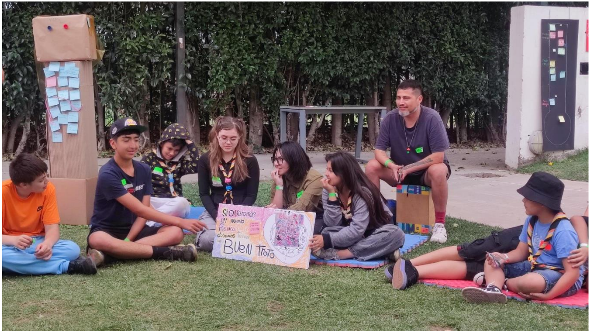
Fotografía 16: Conclusiones grupo 2.