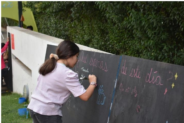
Fotografía 5: Dazibao