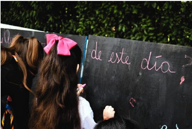
Fotografía 3: Dazibao

Una vez todos/as los/as participantes se encontraron en el espacio, se realizó un círculo de bienvenida donde se dio la bienvenida, se explicó el sentido y objetivos de la Escucha Creativa y se realizó una dinámica de activación.