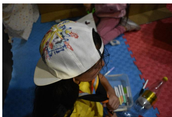
Fotografía 10: Maestranza grupo 1.