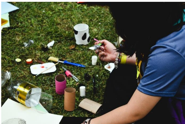
Fotografía 13: Maestranza grupo 3.