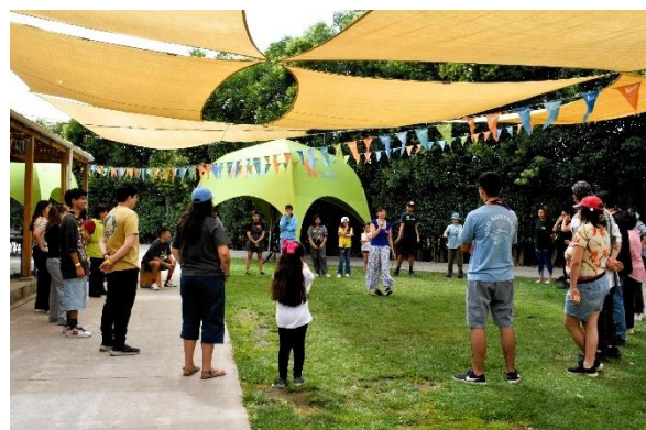
Fotografía 8: Dinámica de activación