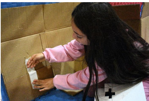
Fotografía 9: Maestranza grupo 1.

Por último, cada grupo tenía el desafío de pensar en la nueva ciudad –o comuna- que les gustaría habitar, señalando en ella sus características y lugares que no podrían faltar. Cada grupo realizó inicialmente una lluvia de ideas donde identificaron lo positivo y negativo de Renca, y luego crearon su ciudad soñada a través de distintos formatos, tales como dibujo, collage –con fotografías e imágenes de referencia- y fanzines.