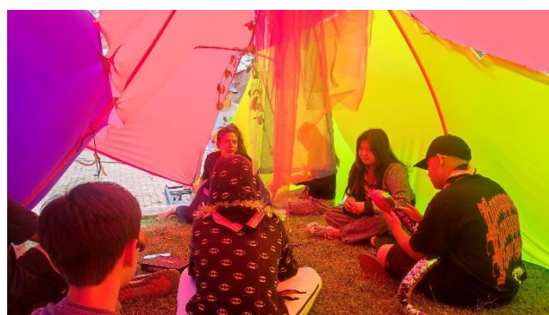
Fotografía 12: Maestranza grupo 2.