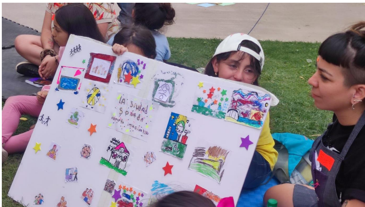
Fotografía 15: Conclusiones grupo 1.

En el Consejo, y con la palabra como protagonista, cada grupo presentó sus creaciones y principales conclusiones de la jornada, relevando el diagnóstico sobre su comuna, sus intereses y cómo se imaginan un futuro Cecrea.