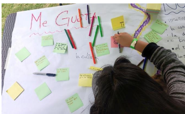
Fotografía 11: Maestranza grupo 2.