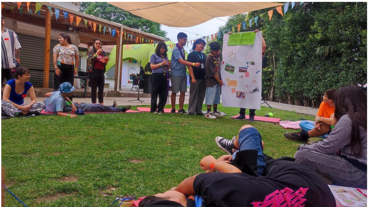
Fotografía 17: Conclusiones grupo 3.