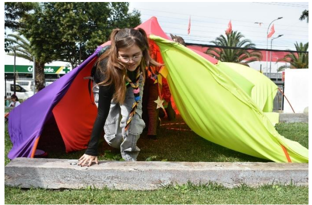
Fotografía 2: Umbral elaborado para la jornada