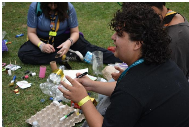
Fotografía 14: Maestranza grupo 3.